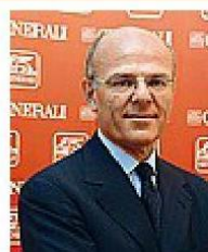
Generali Mario Greco

Polizze: chi si merita lo scudetto delle tariffe