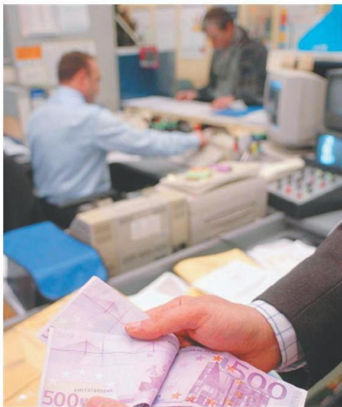
Gli spread delle banche nel mirino delle associazioni dei consumatori

Sul mercato si affaccia una nuova pratica. Il via è arrivato con la sentenza 350 della Cassazione sul reato di usura originaria. Da molti studi legali e dalle associazioni di consumatori, questa sentenza viene interpretata a favore delle famiglie e delle imprese. In pratica se nei contratti di mutuo la somma tra Tan e interessi di mora supera il tasso soglia usura, al-