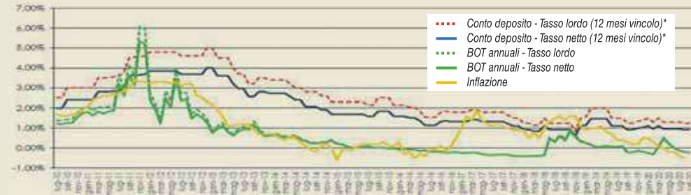
* I tassi massimi rivelati ogni mese su ConfrontaConti si riferiscono a depositi di 10.000 euro vincolati per 12 mesi. Fonte: ConfrontaConti